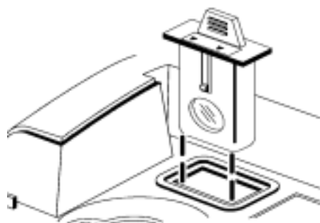
图 3 将过滤装置插入小室